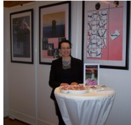
Wedding-Artist-Stand auf der TrauDich! 2014